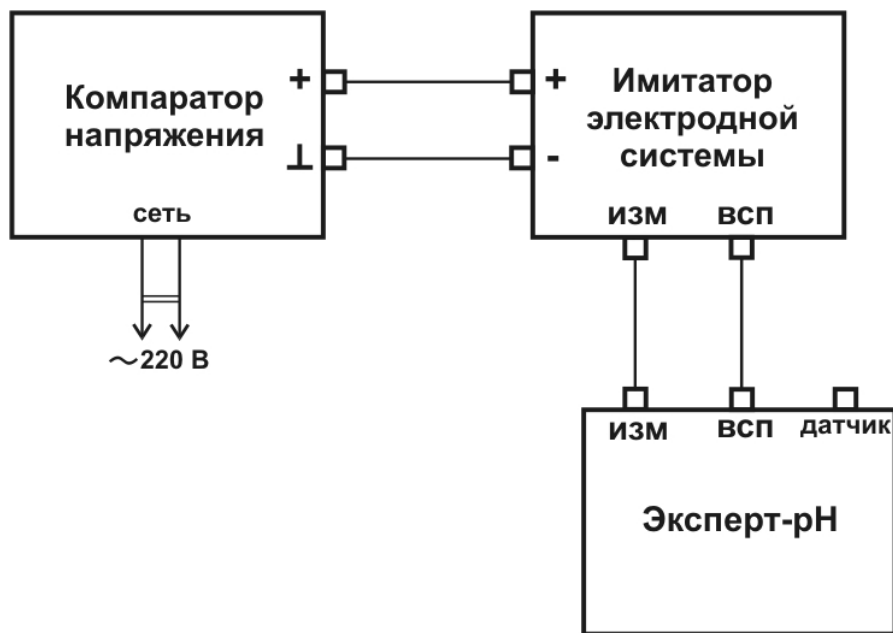
Рисунок А.1 — Схема установки для поверки измерительного преобразователя.